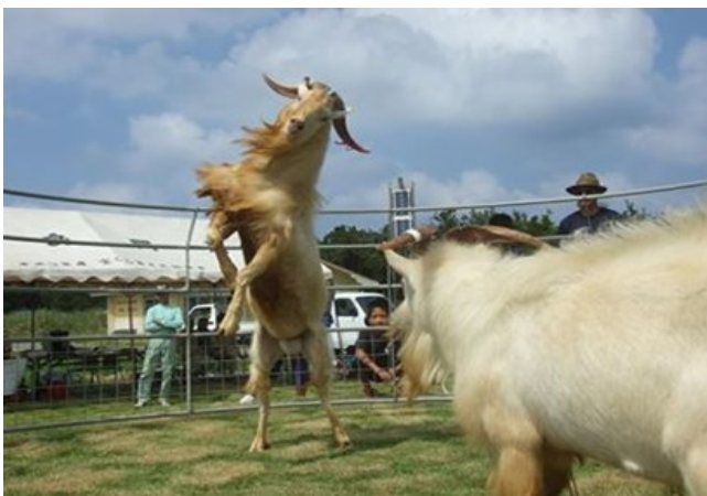
Goats fight in a special ring

Visit our Facebook page (in Japanese) at